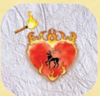
La Volonté de R'hllor

On effectue cet ordre lors de l'étape de résolution des ordres de raid de la phase action. Lors de l'exécution de cet ordre, le joueur Baratheon peut immédiatement défausser