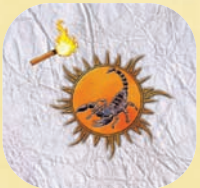
La piqûre du Scorpion

2) La Maison Martell ne peut pas défausser la dernière carte d'un joueur. Un joueur n'ayant plus qu'une carte en main n'est pas affecté par la Piqûre du Scorpion.