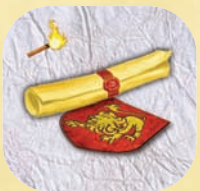
La ruse du lion

On effectue cet ordre lors de l'étape de résolution des ordres de raid de la phase action. Lors de l'exécution de cet ordre, le joueur Lannister peut nommer une Maison avec des unités adjacentes à cette zone. La maison nommée ne peut pas faire de marche, faire de raid, ni faire de soutien (mais peut soutenir en défense) contre une zone contrôlée par le joueur Lannister pour le reste de ce tour.