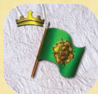
La Puissance de Hautjardin

On effectue cet ordre lors de l'étape de résolution des ordres de consolidation de pouvoir de la phase action. Lors de l'exécution de cet ordre, le joueur Tyrell doit